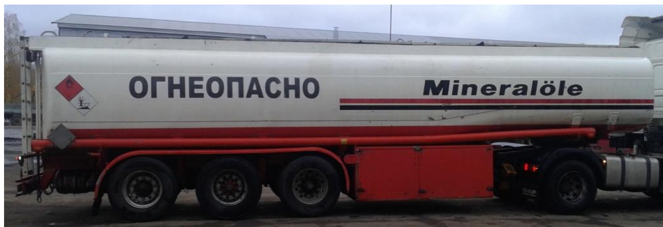
Рисунок 1 - Общий вид полуприцепа-цистерны ESTERER 5298

Схема пломбировки для защиты от несанкционированного изменения положения указателя уровня налива, обозначение места нанесения знака поверки представлены на рисунке 2.