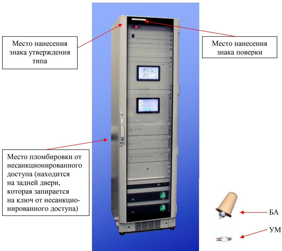
Рисунок 2 - Внешний вид СЕВ-БЭГ и схема пломбировки