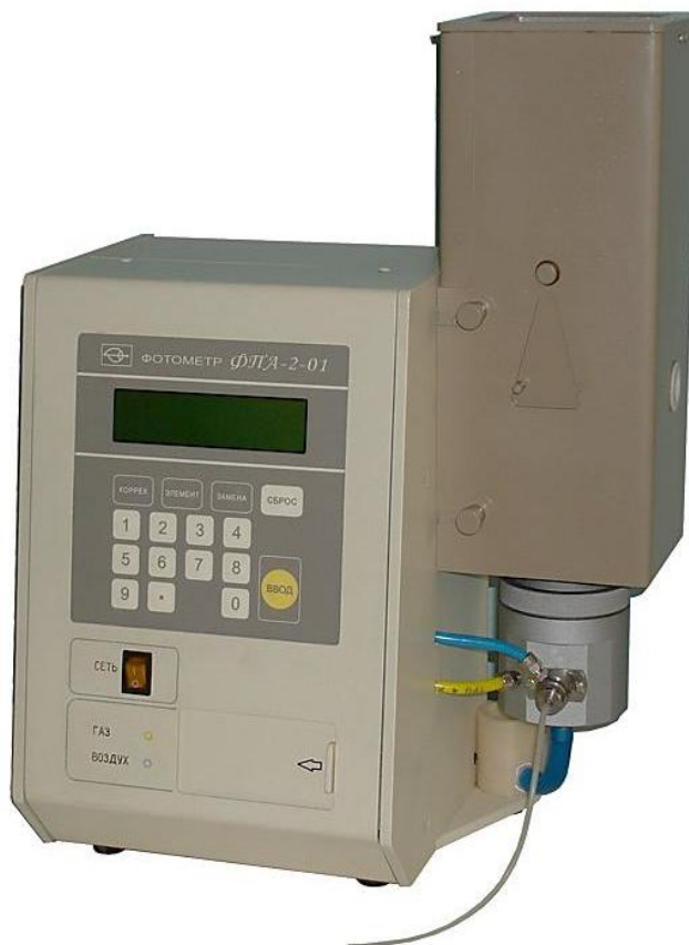
Рисунок 1 - Общий вид оптико-электронного блока фотометра ФПА-2-01

Схема пломбировки от несанкционированного доступа, обозначение места нанесения знака поверки представлены на рисунке 2.