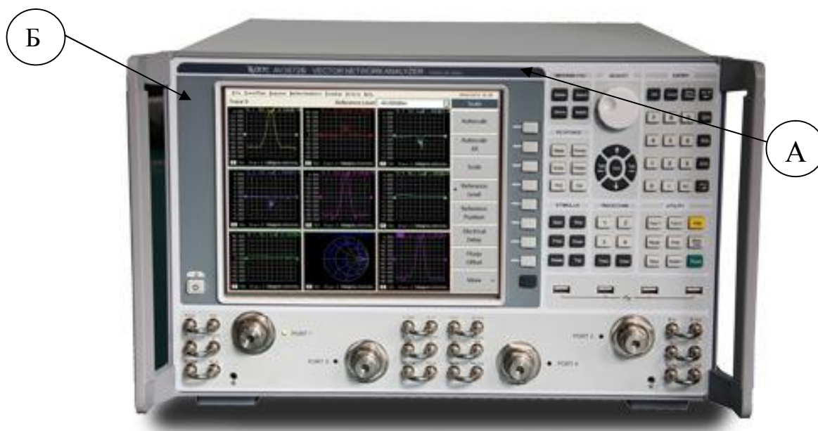
А) Место для размещения знака утверждения типа Б) Место для размещения знака поверки Рисунок 1 - Общий вид анализаторов. Вид спереди