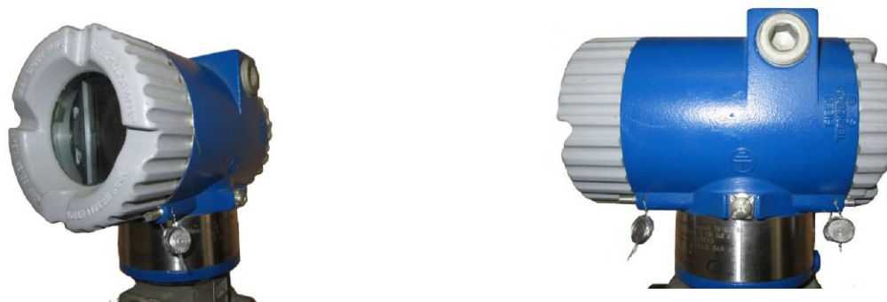
Рисунок 2 - Места опломбирования преобразователя давления