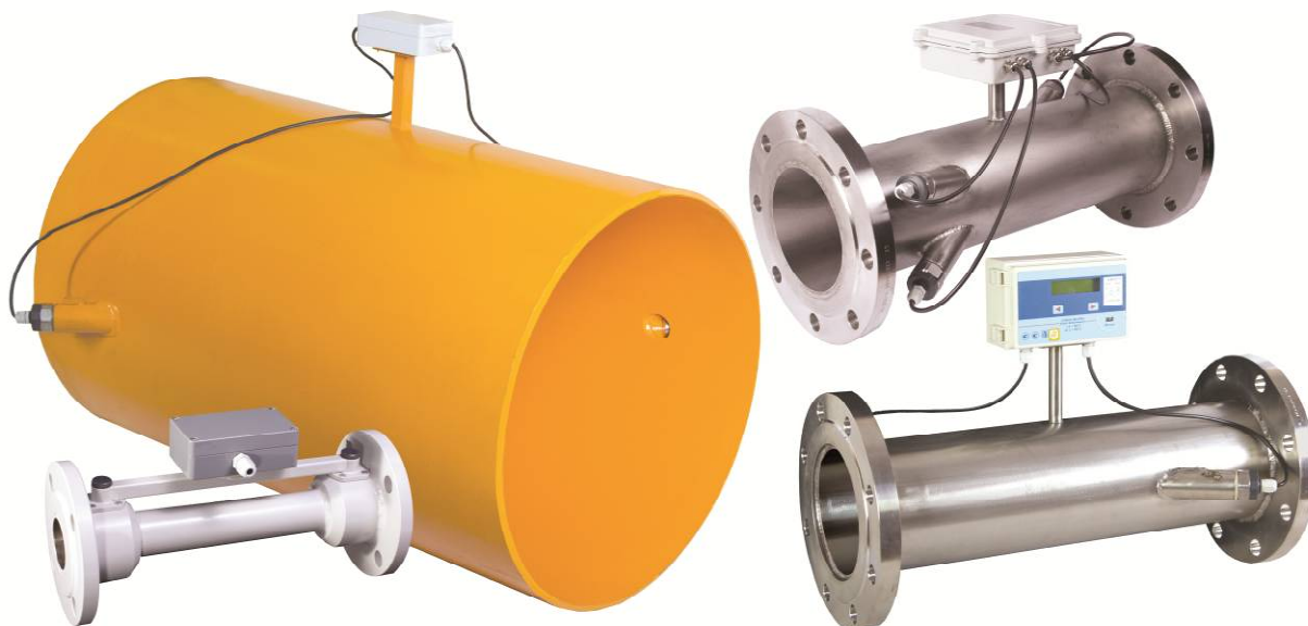
Рисунок 1 - Внешний вид счетчика ВИРС-У

Внешний вид счетчика приведен на рисунке 1. Схема нанесения знаков поверки и пломбировки для защиты от несанкционированного доступа к элементам счетчика приведена на рисунке 2.