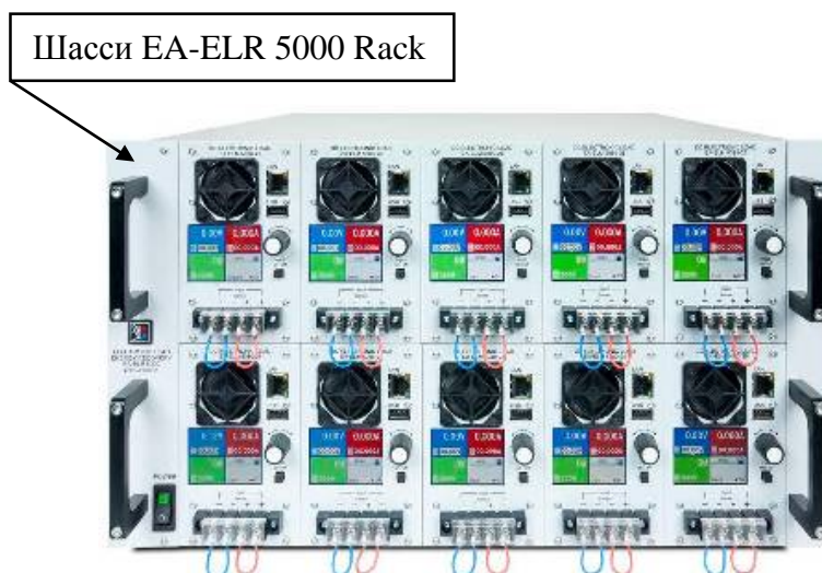
Рисунок 2 - Общий вид нагрузок серии EA-ELR 5000 в шасси EA-ELR 5000 Rack