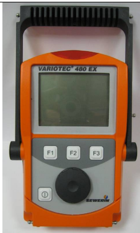
б) VARIOTEC модели 400 Ex, 450 Ex, 460 Ex, 480