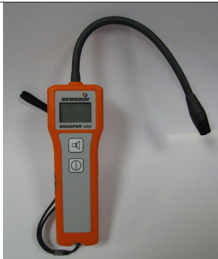
г) SNOOPER mini