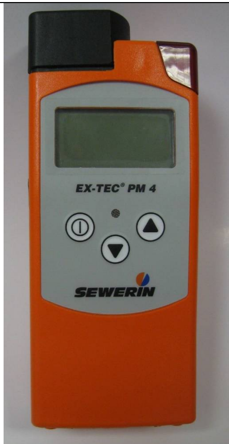
в) EX-TEC модели PM4