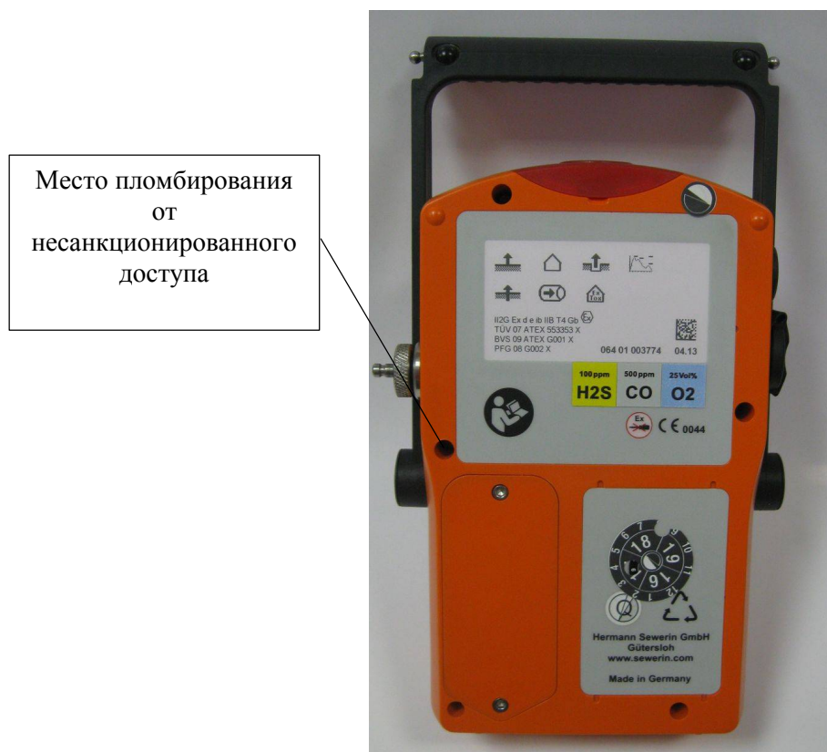
Рисунок 2 - Схема пломбирования корпуса газоанализаторов от несанкционированного доступа (на примере EX-ТЕС модели HS 680)