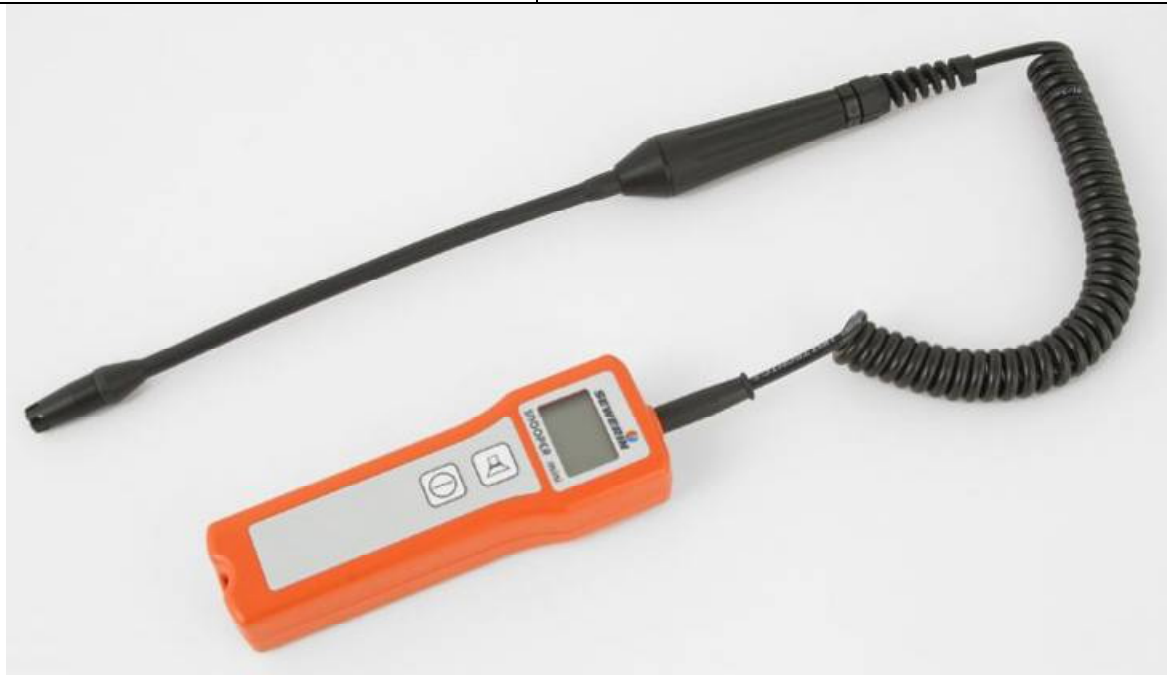
д) SNOOPER mini H