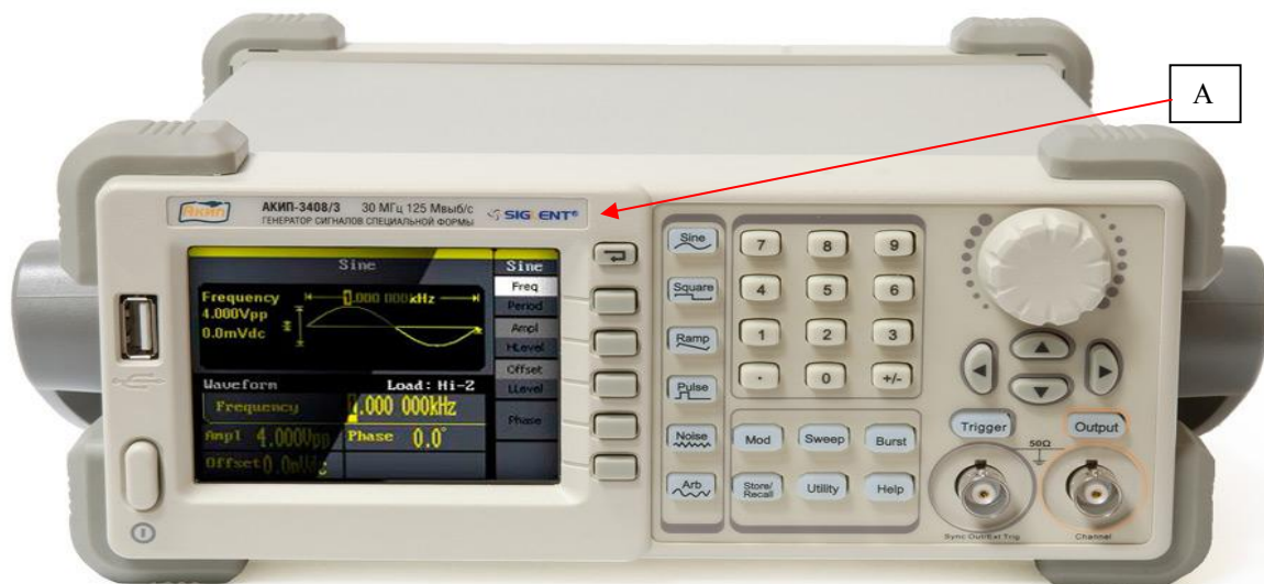
Генераторы серии АКПП-3408