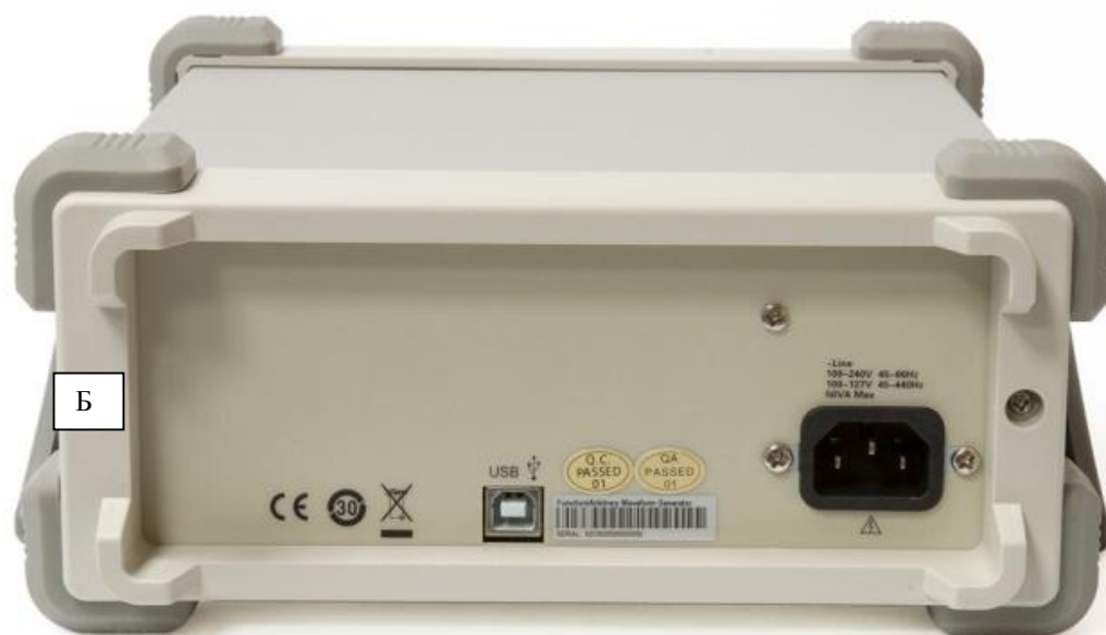
Рисунок 2 - Место опломбирования от несанкционированного доступа (Б)

Метрологические и технические характеристики представлены в таблицах 2 - 16.