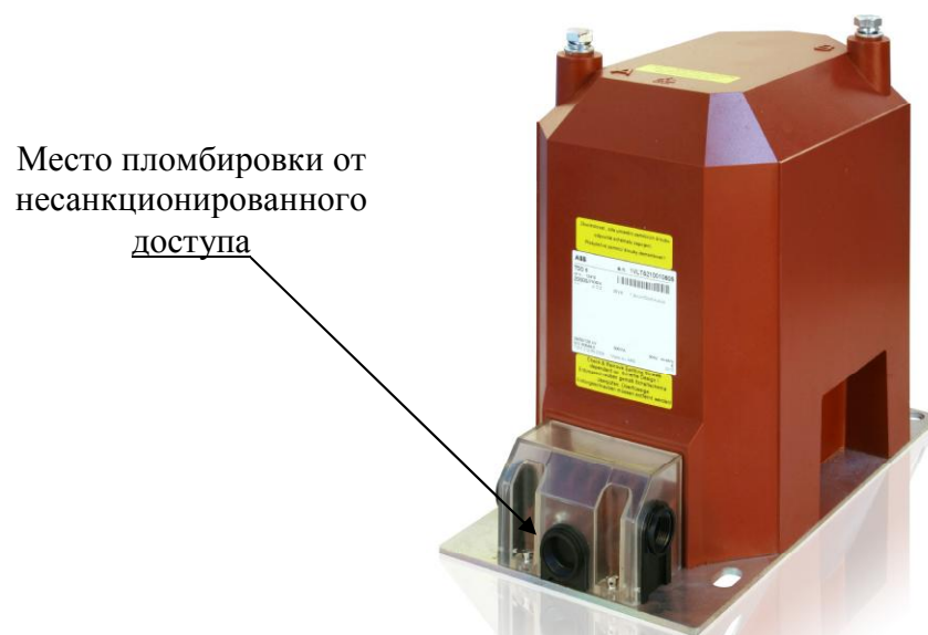
Рисунок 1 - Внешний вид трансформаторов напряжения двухфазных TDC 6.X-G