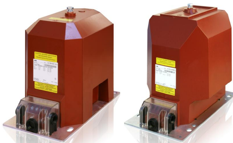
Рисунок 2 - Внешний вид трансформаторов напряжения однофазных TJS 6.X-G и TJS 7.X-G