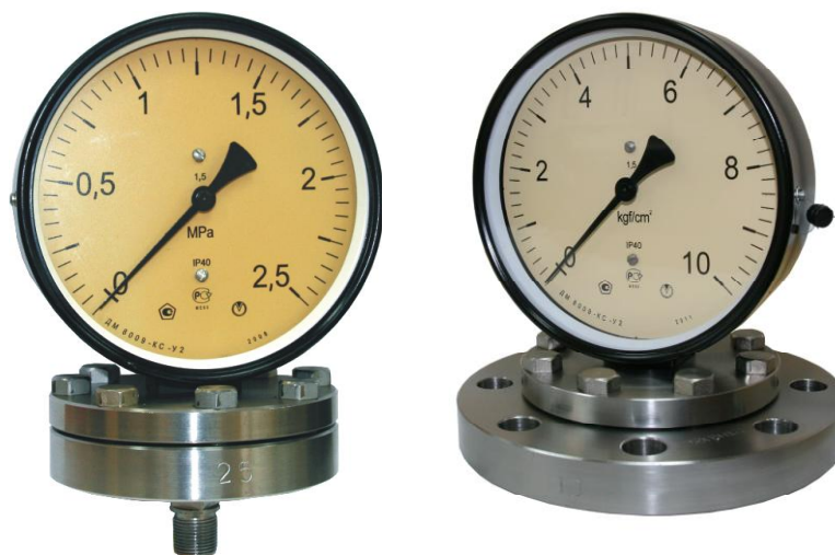
Рисунок 1 - Фотографии общего вида манометров

Фотографии общего вида манометров приведены на рисунке 1.