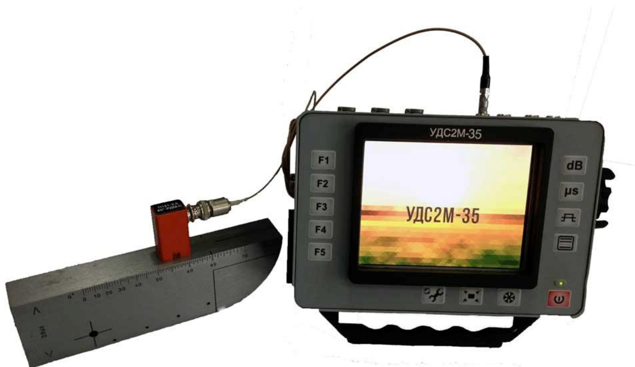
Рисунок 1 - Общий вид

Измерение координат залегания дефектов и амплитуд эхо-сигналов от них производится автоматически с выводом информации на экран цветного индикатора. При выявлении дефектов в установленных зонах контроля предусмотрена возможность срабатывания звуковой и световой сигнализации.