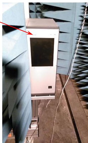
Рисунок 5 - Внешний вид контроллера движения сканера

Места для пломбировки от несанкционированного доступа