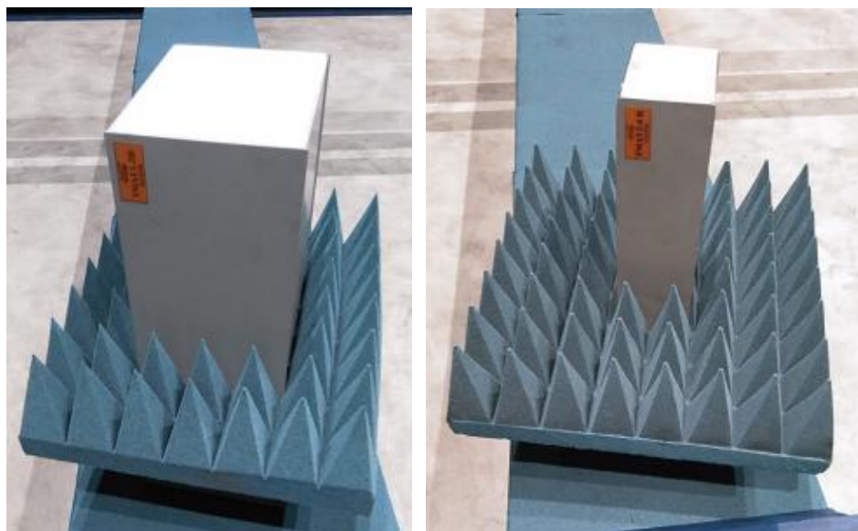
Рисунок 4 - Внешний вид антенн-зондов диапазона частот от 1 до 4 ГГц