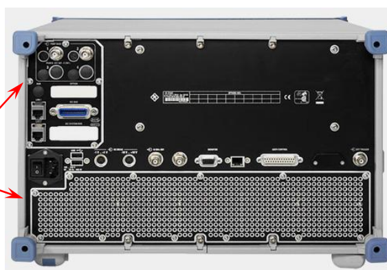
Рисунок 6 - Задняя панель векторного анализатора цепей

Места для пломбировки от несанкционированного доступа