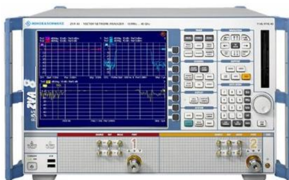
Рисунок 3 - Внешний вид векторного анализатора цепей