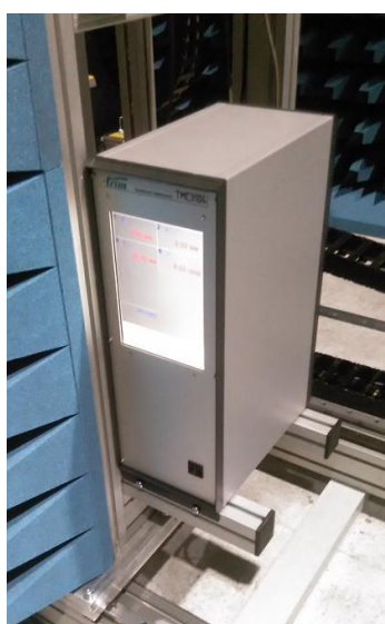
Рисунок 2 - Общий вид контроллера движения сканера