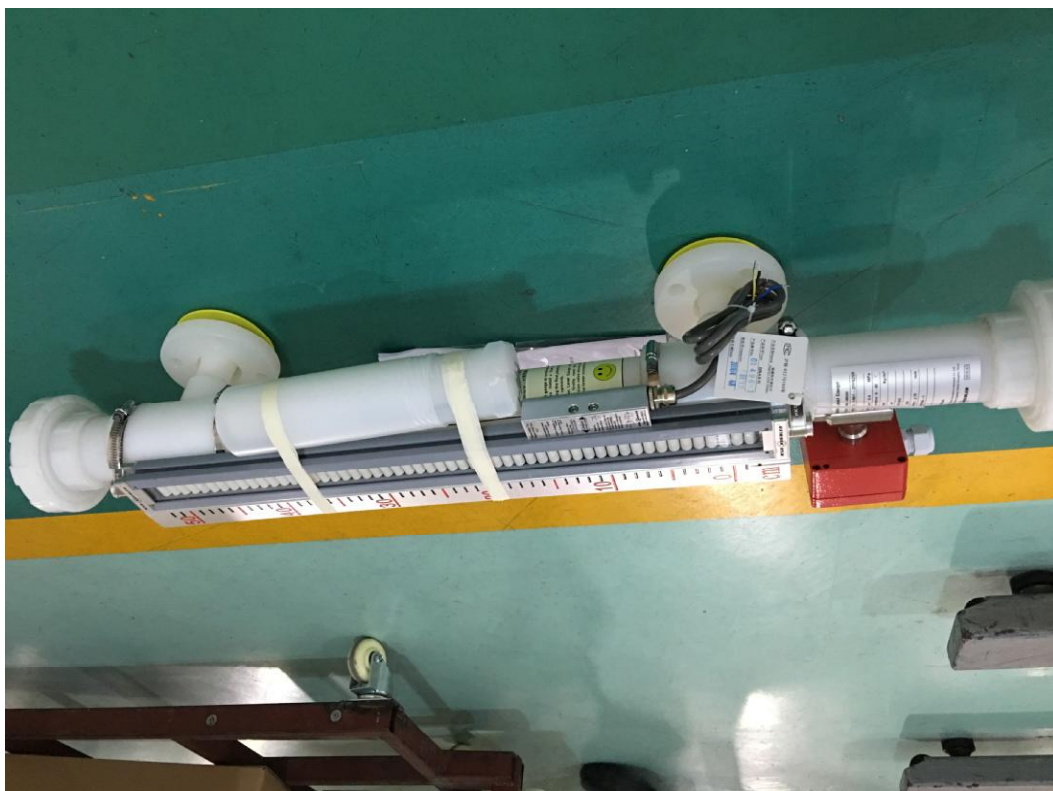
Рисунок 1 - Уровнемеры BNA

Место опломбирования уровнемеров изображено на рисунке 2.