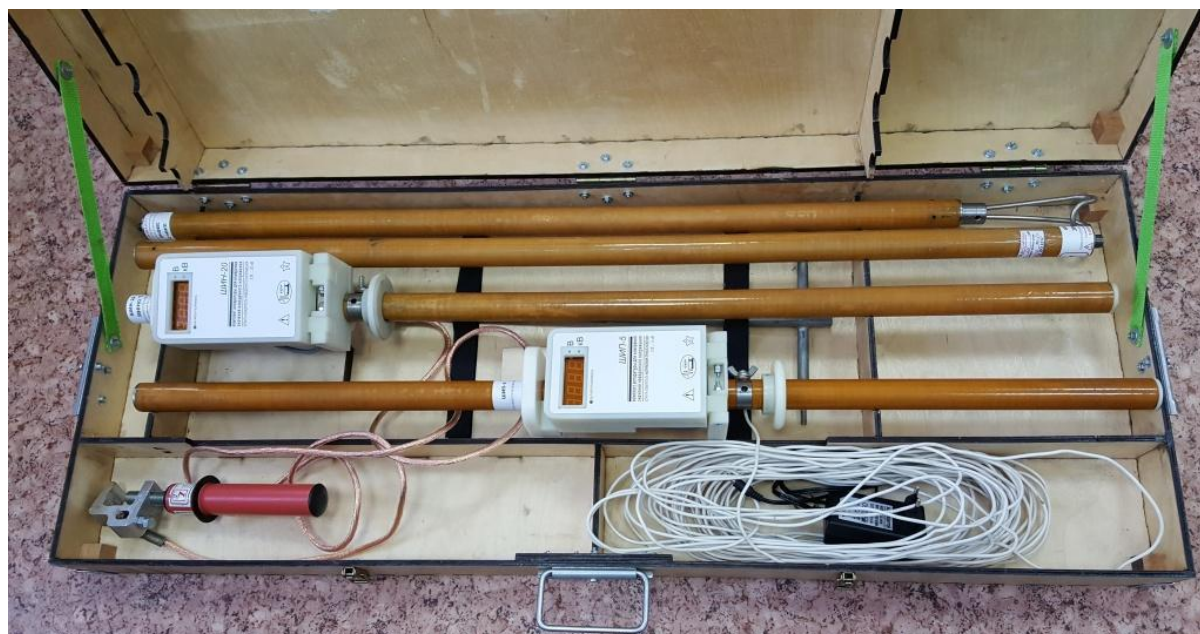
Рисунок 1 - Общий вид средства измерений