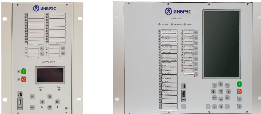
Рисунок 2 - Общий вид контроллеров