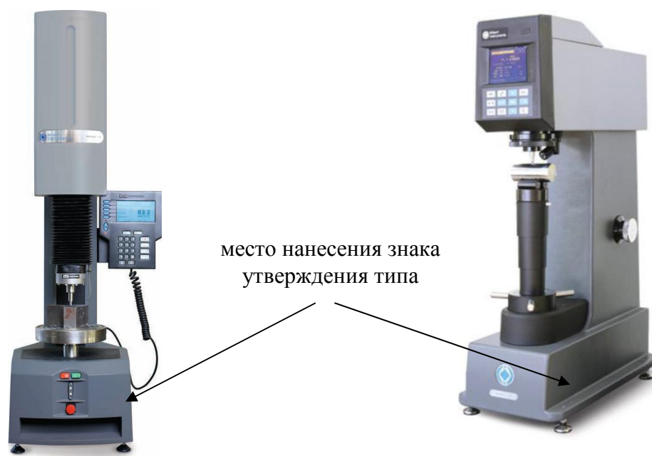
Твердомеры 2000Т, 2000R, 2000S

Внешний вид твердомеров с указанием мест нанесения знака утверждения типа и пломбирования приведен на рисунках 1, 2 и 3.