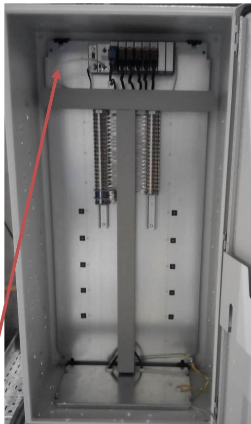
Рисунок 4 - Шкаф датчиков давления 2

Место нанесения наклеек знаков утверждения типа