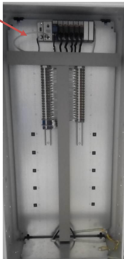
Рисунок 6 - Шкаф датчиков давления 4