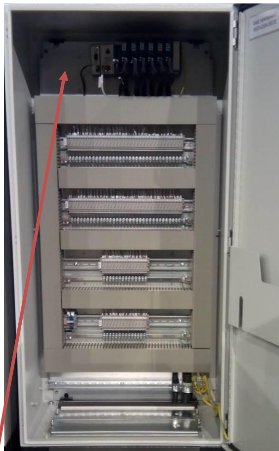
Рисунок 8 - Шкаф термopарный 2

Место нанесения наклеек знаков утверждения типа