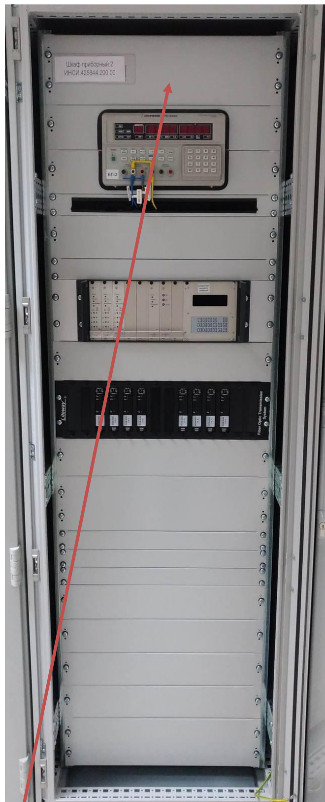
Рисунок 2 - Шкаф приборный 2

Место нанесения наклеек знаков утверждения типа