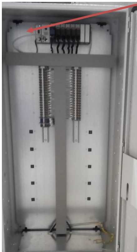
Рисунок 5 - Шкаф датчиков давления 3

Место нанесения наклеек знаков утверждения типа