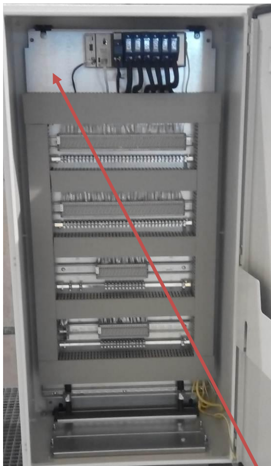
Рисунок 7 - Шкаф термopарный 1