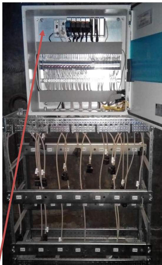
Рисунок 12 - Шкаф расходомерного коллектора 2

Место нанесения наклеек знаков утверждения типа