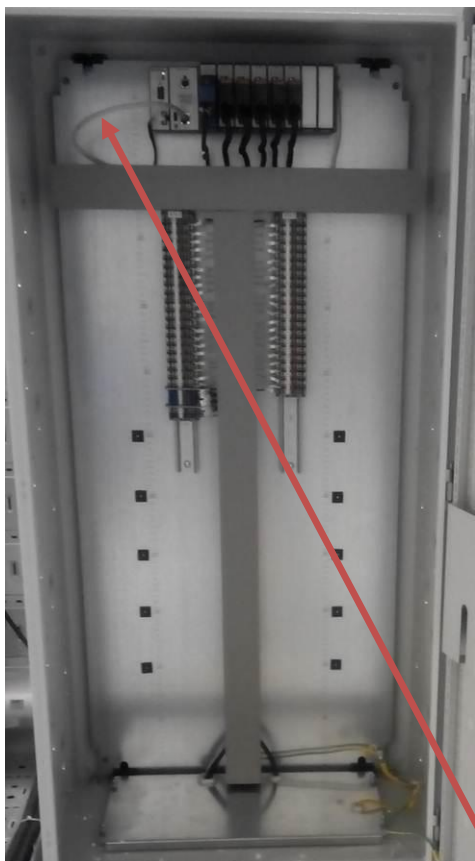
Рисунок 3 - Шкаф датчиков давления 1