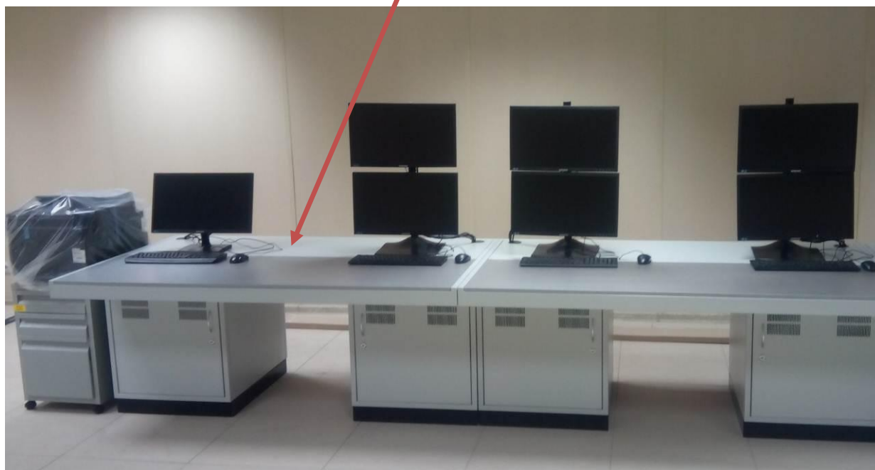
Рисунок 13 - Рабочее место Пломбирование ИВК не предусмотрено.

Место нанесения наклеек знаков утверждения типа