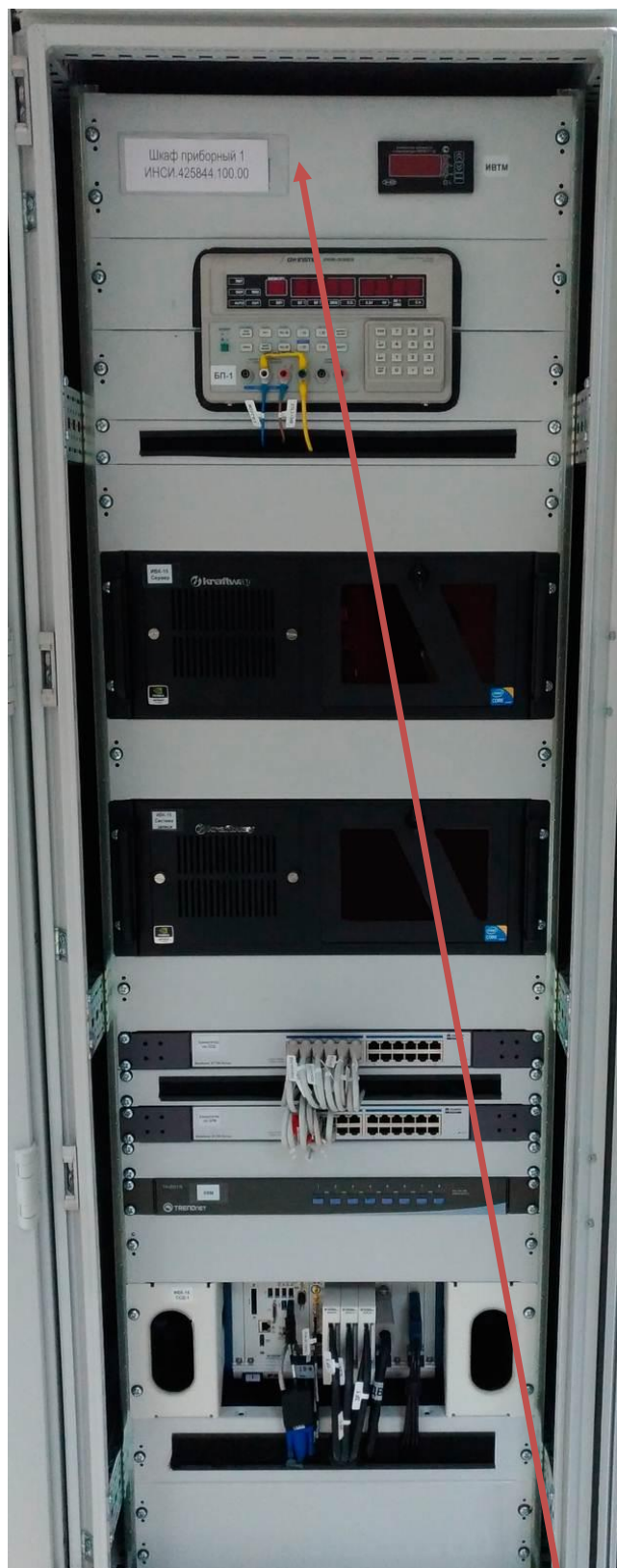
Рисунок 1 - Шкаф приборный 1