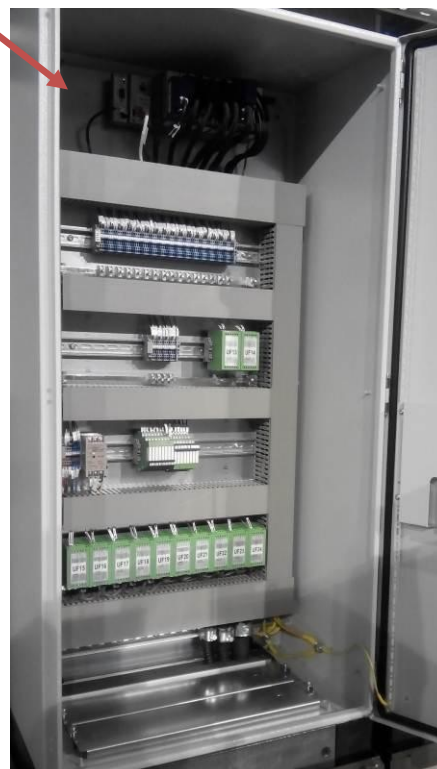
Рисунок 10 - Шкаф аналоговых сигналов 2