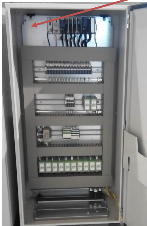
Рисунок 9 - Шкаф аналоговых сигналов 1

Место нанесения наклеек знаков утверждения типа