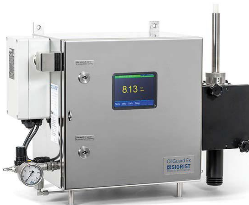
Рисунок 2 - Анализаторы содержания нефтепродуктов в воде OilGuard 2 EX