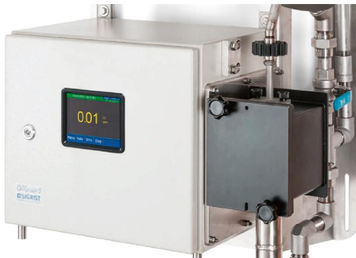
Рисунок 1 - Анализаторы содержания нефтепродуктов в воде OilGuard 2

Схема пломбировки от несанкционированного доступа, обозначение места нанесения знака поверки представлены на рисунке 3.