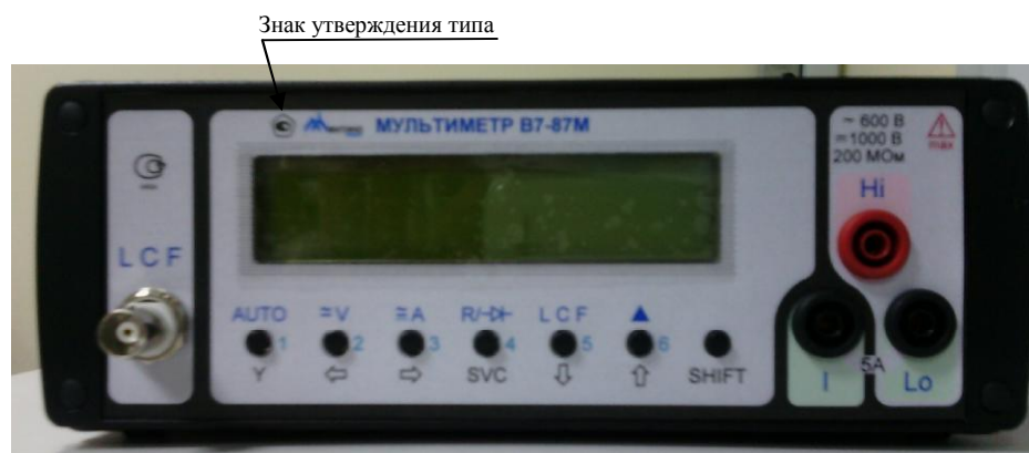
Рисунок 1 - Общий вид мультиметра

Схема пломбировки от несанкционированного доступа представлена на рисунке 2.