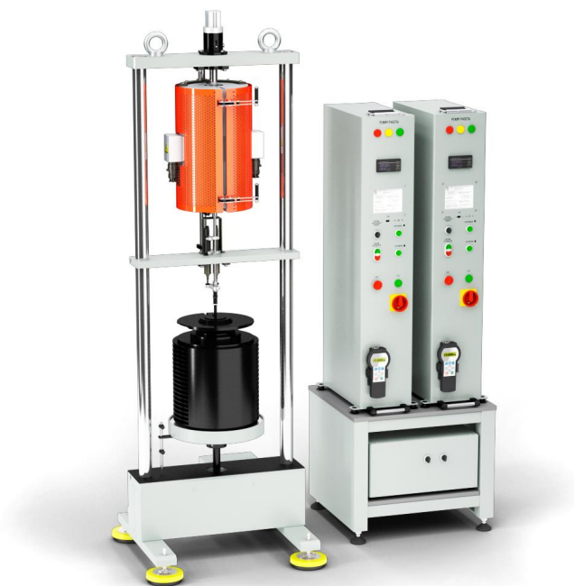
Рисунок 2 - Общий вид машин UTC 1300-1-2-X-ПНС