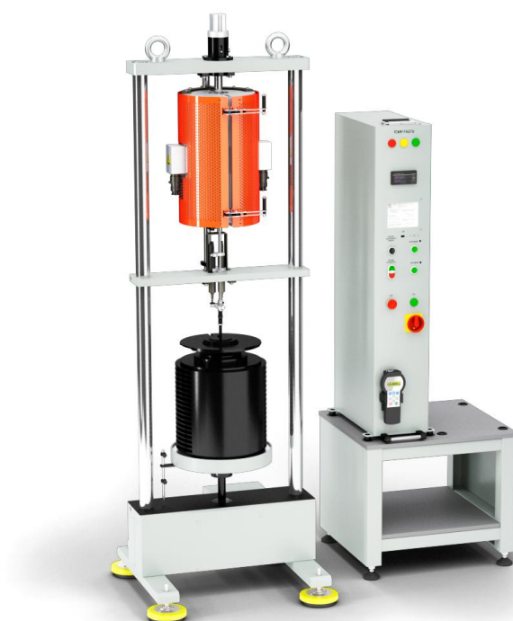
Рисунок 3 - Общий вид машины UTC 1300-1-2-X-ПН-1