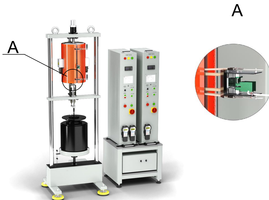
Рисунок 1 - Общий вид машин УТС 1300-1-2-Х-ПН

Общий вид машин представлен на рисунках 1 - 3.