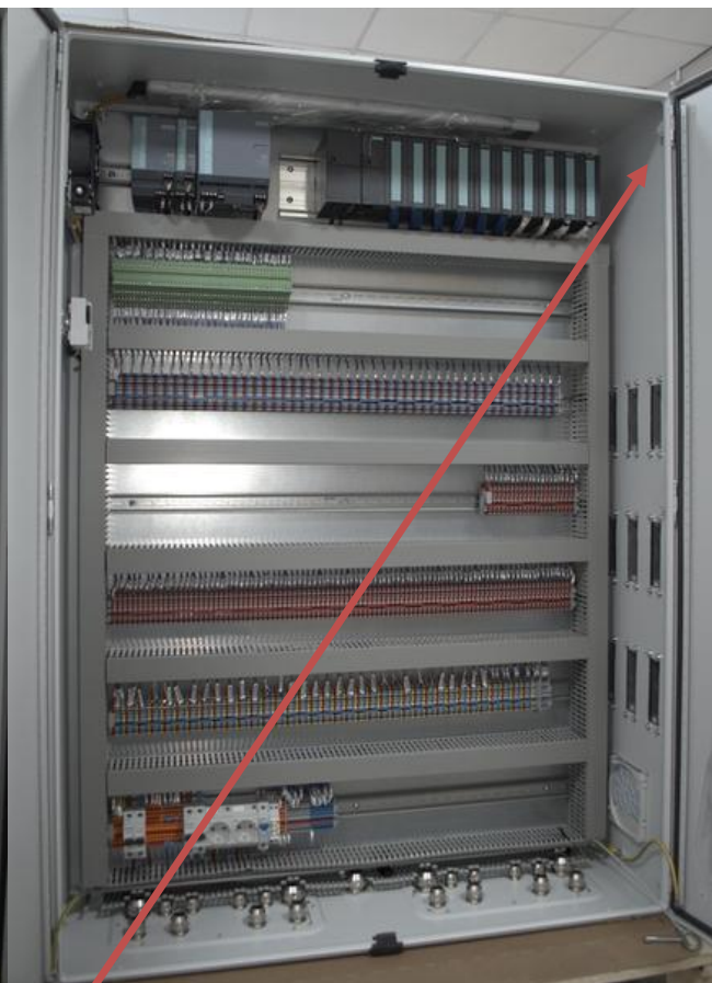
Рисунок 4 - Шкаф ПЛК стенда 15 МВт

Место нанесения наклеек знаков утверждения типа