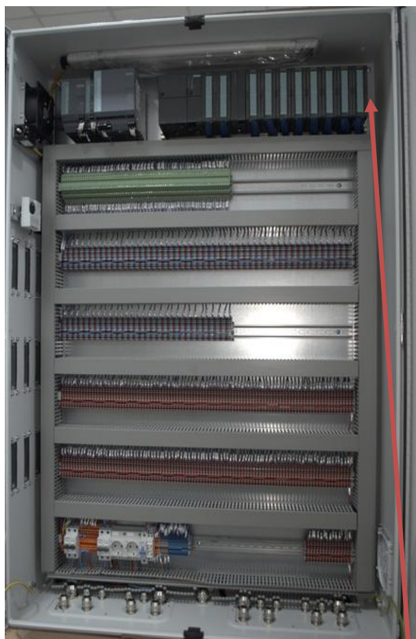
Рисунок 5 - Шкаф ПЛК стенда 40 МВт (шкаф дискретных сигналов)