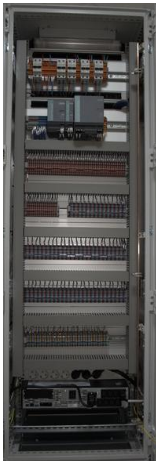
Рисунок 2 - Шкаф главного ПЛК (вид сзади)

Место нанесения наклейки знака утверждения типа