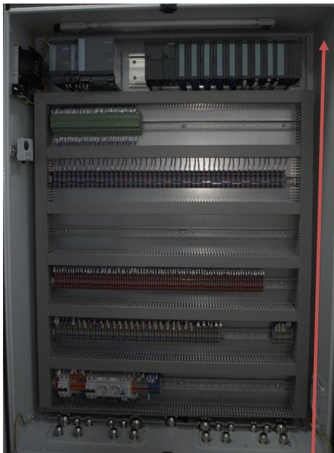
Рисунок 3 - Шкаф ПЛК топливной системы