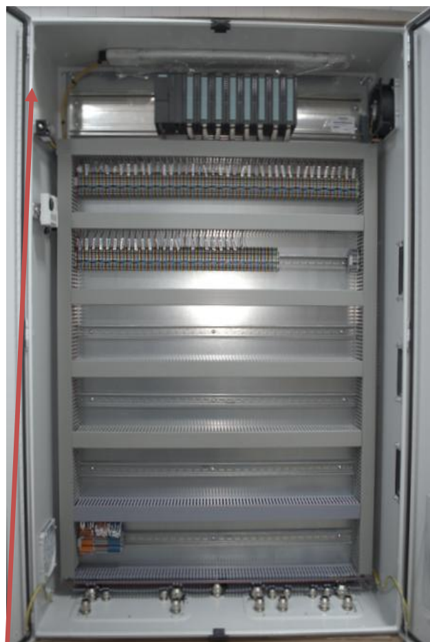
Рисунок 6 - Шкаф ПЛК стенда 40 МВт (шкаф аналоговых сигналов)

Место нанесения наклеек знаков утверждения типа