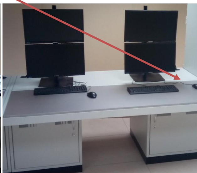
Рисунок 7 - Пульт управления

Пломбирование АСУТСО СИКК не предусмотрено.