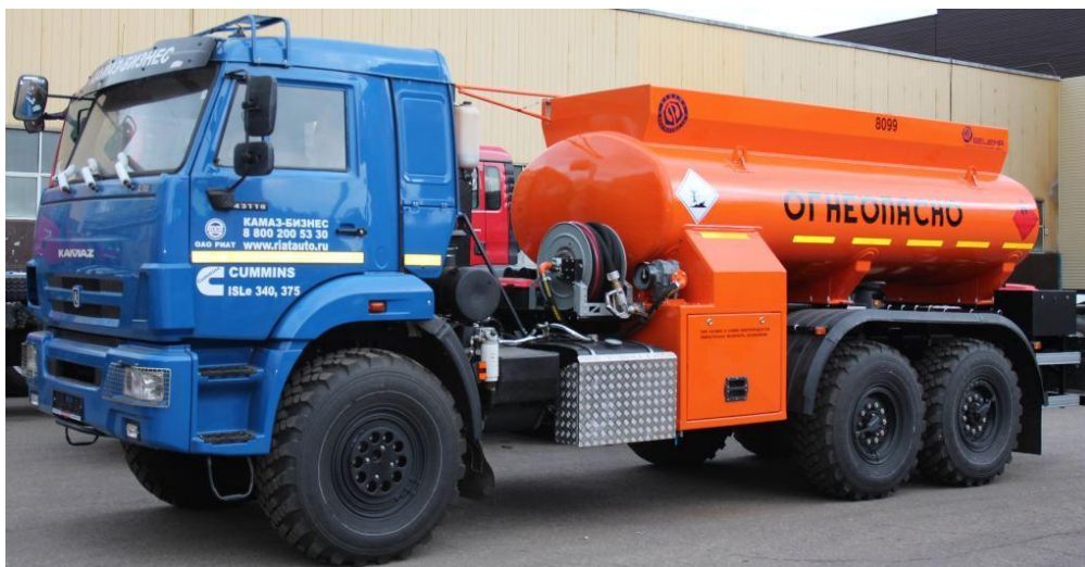
Рисунок 1 - Общий вид автоцистерны БЦМ-221.2 модель 56475-0000010-13

Общие виды АЦ, АТЗ, ППТЗ, ППЦ, ПЦ представлены на рисунках 1, 2, 3, 4 и 5.