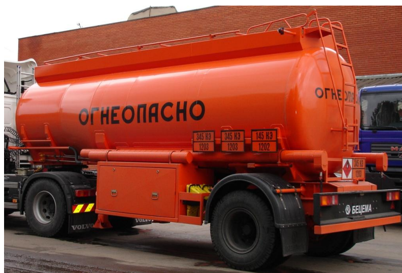
Рисунок 4 - Общий вид полуприцепа-топливозаправщика БЦМ-48 модель 96054-0000010