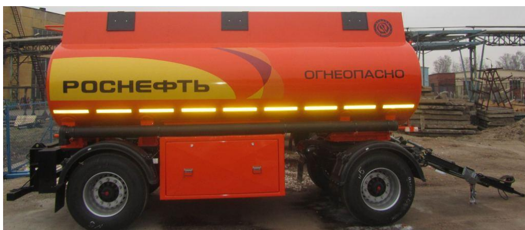
Рисунок 5 - Общий вид прицепа-цистерны БЦМ-230 модель 86413-0000010

Схема пломбировки для защиты от несанкционированного изменения положения указателя уровня налива, обозначение места нанесения знака поверки представлены на рисунке 6.