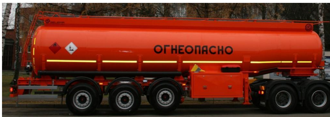
Рисунок 3 - Общий вид полуприцепа-цистерны БЦМ-111 модель 960511-0000010-01