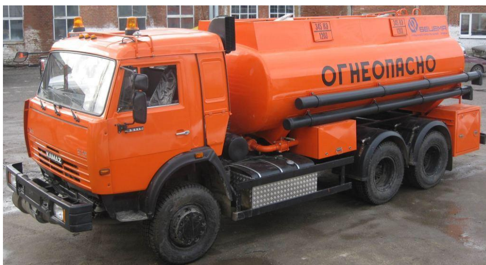
Рисунок 2 - Общий вид автотопливозаправщика БЦМ-221 модель 56475-0000010-04