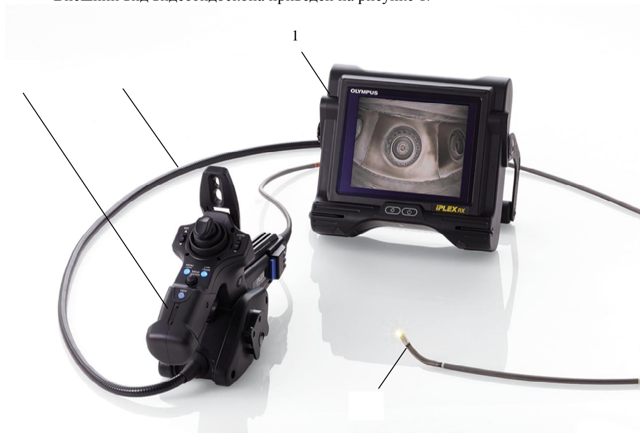
Рисунок 1 - Общий вид видеоэндоскопов измерительных OLYMPUS IPLEX RX (1 - блок системный, 2 - блок управления, 3- зонд, 4 - оптический адаптер)

Внешний вид видеоэндоскопа приведен на рисунке 1.