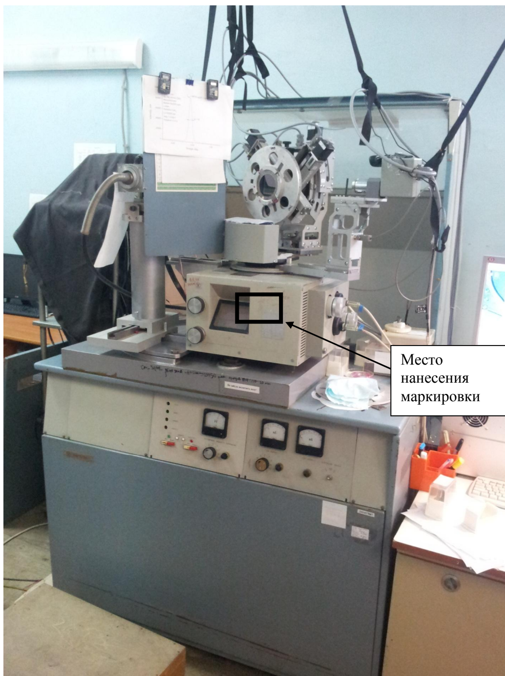
Рисунок 2 - Места нанесения краткого наименования модели, заводского номера, знака утверждения типа, знака поверки