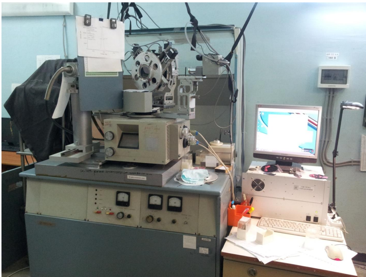
Рисунок 1 – Общий вид установки для анализа состава монокристаллических пленок