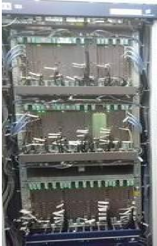
Рисунок 1 - Общий вид оборудования с открытой дверью

Общий вид оборудования и место блокировки от несанкционированного доступа, представлены на рисунках 1 и 2.