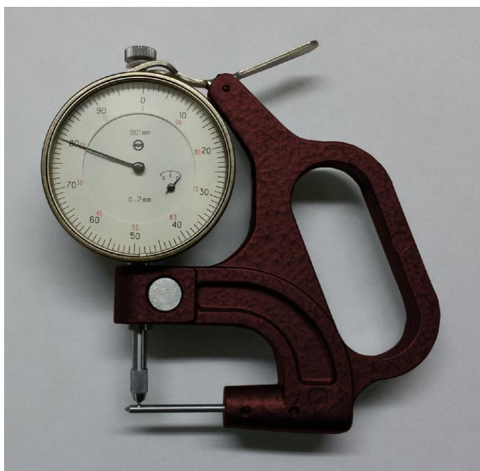
Рисунок 1 - Общий вид стенкомеров типов С-2, С-10А