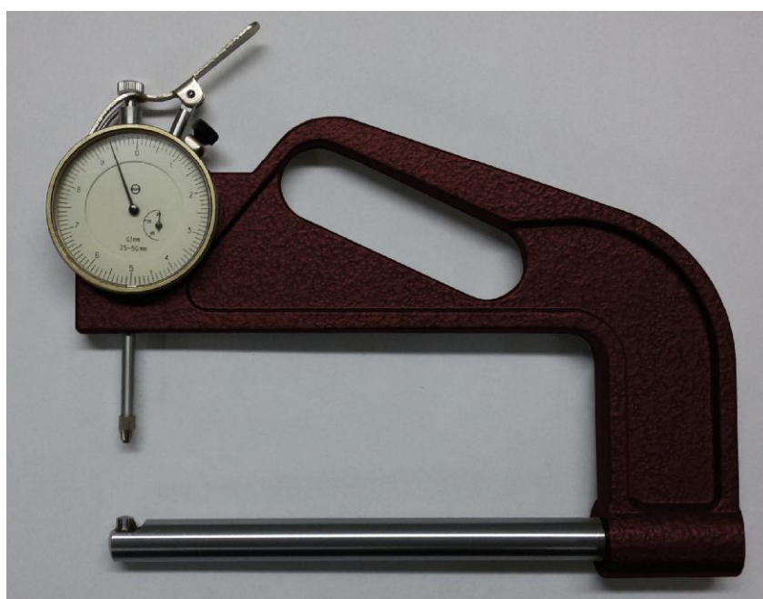
Рисунок 3 - Общий вид стенкомеров типов С-25, С-50

Пломбирование корпуса стенкомеров индикаторных с ценой деления 0,01 и 0,1 мм не предусмотрено.