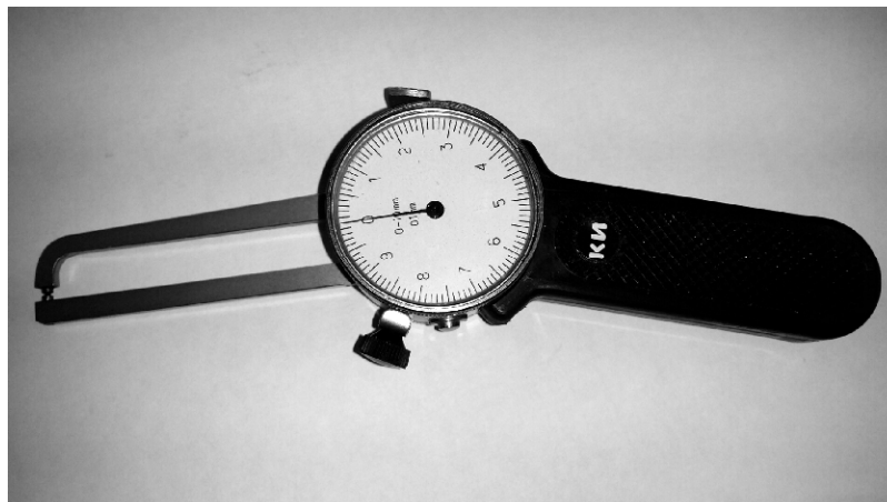
Рисунок 2 - Общий вид стенкомеров типа С-10Б