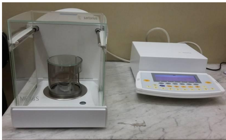
Рисунок 1 - Общий вид весов