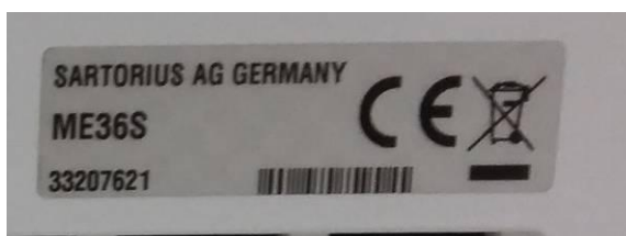
Рисунок 4 - Маркировка весов