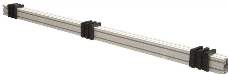
Рисунок 2 - Общий вид меры HiStraight ST 83200