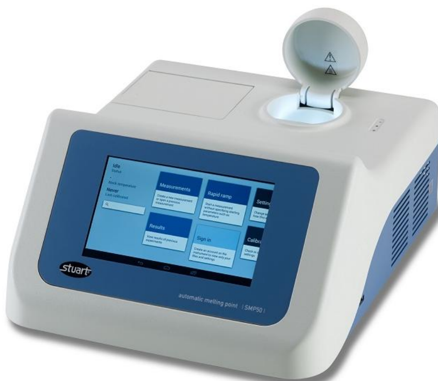
Рисунок 1 - Общий вид приборов

Схема пломбировки от несанкционированного доступа, обозначение места нанесения знака поверки представлены на рисунке 2.