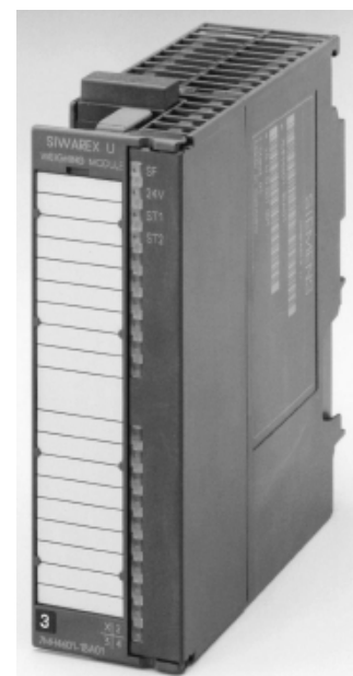
Рисунок 2 - Общий вид модуля SIWAREX U