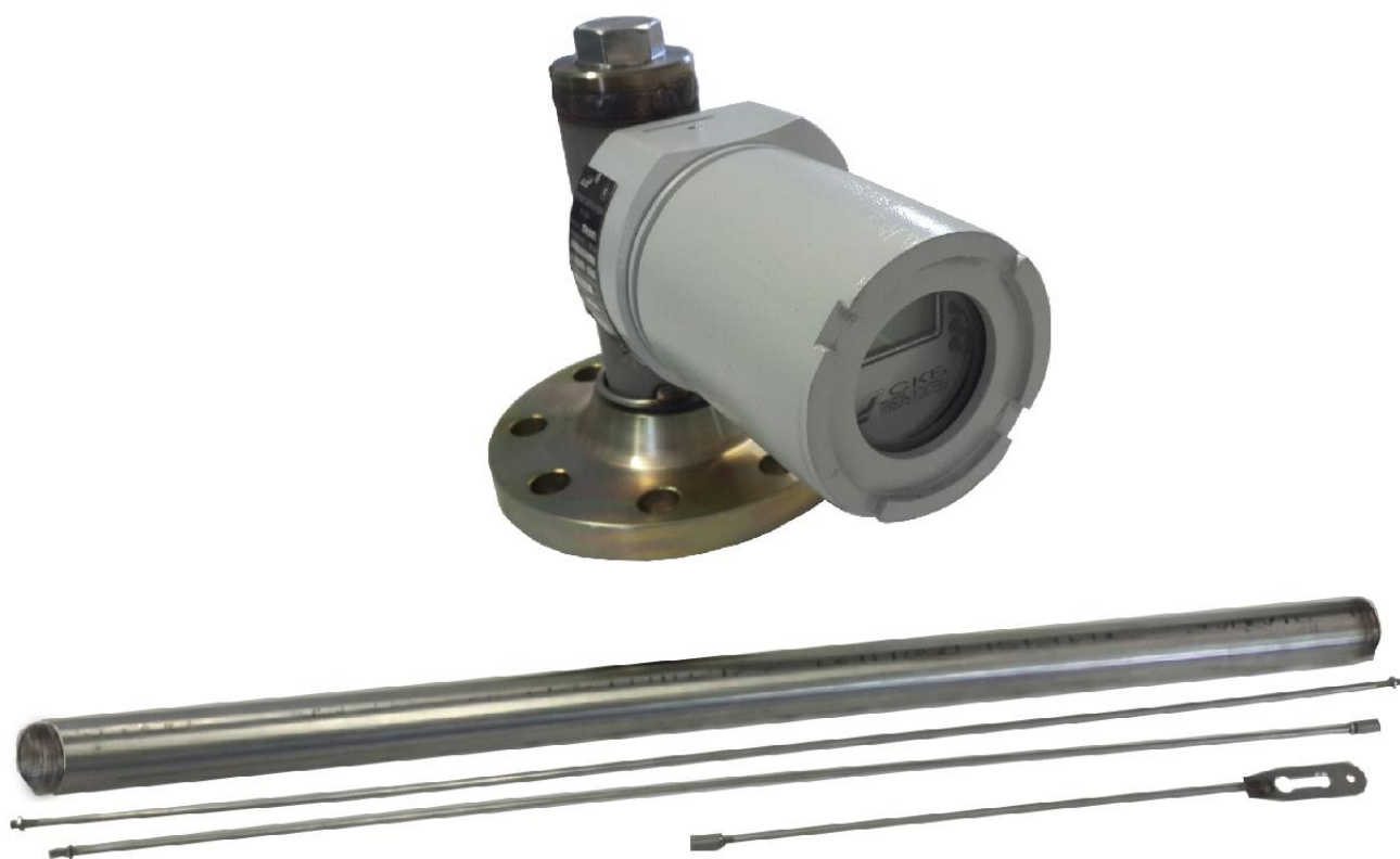
Рисунок 1 - Общий вид преобразователей уровня буйковых электрических УБ-ЭМ1