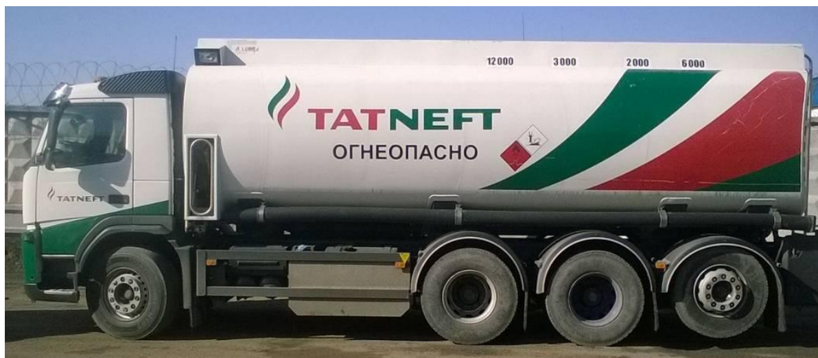
Рисунок 1 - Общий вид автоцистерны VOLVO FM 370

Схема пломбировки для защиты от несанкционированного изменения положения указателя уровня налива, обозначение места нанесения знака поверки представлены на рисунке 2.