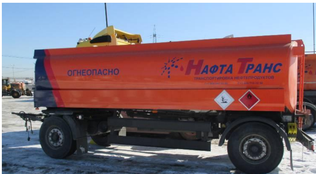
Рисунок 1 - Общий вид прицепа-цистерны ESTERER

Схема пломбировки для защиты от несанкционированного изменения положения указателя уровня налива, обозначение места нанесения знака поверки представлены на рисунке 2.