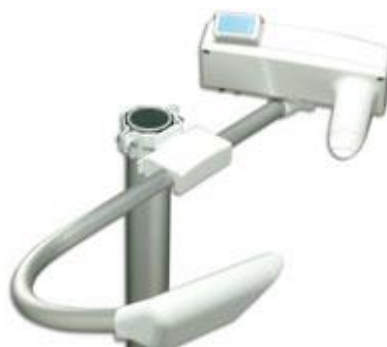
Рисунок 1 - Общий вид нефелометров PWD