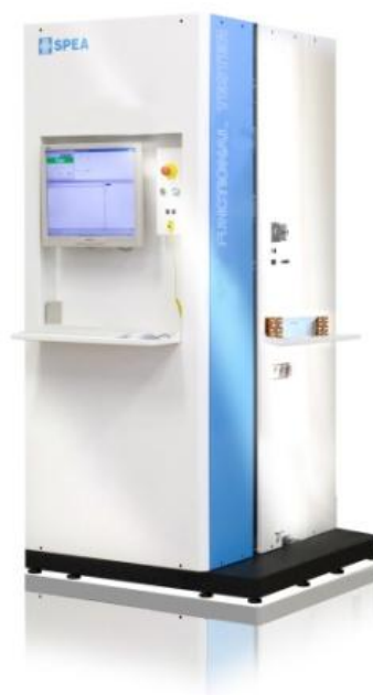
Рисунок 2 – Общий вид тестера SPEA C430 (без головной части)