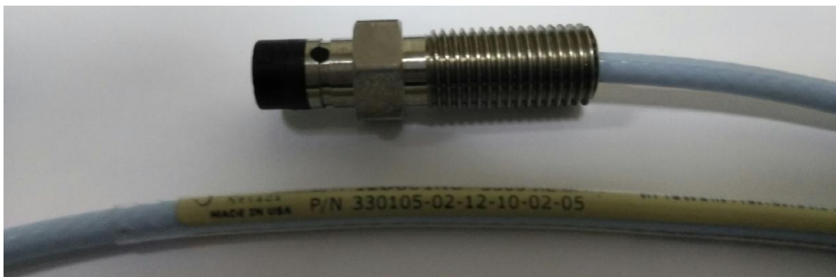
Рисунок 1 - Общий вид первичного преобразователя модификации BN-330105-02-12-10-02-05