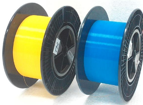
Рисунок 2 – Общий вид катушки с кабелем ЧЭ