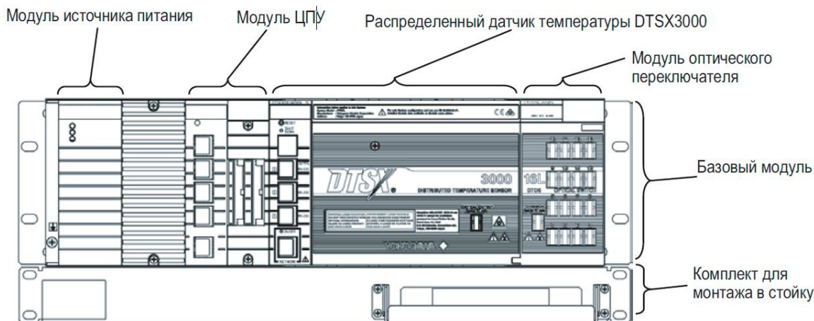
Рисунок 1 – Модули, входящие в состав систем мониторинга распределения температуры волоконно-оптических модульных повышенной дальности DTSXL

Системы мониторинга распределения температуры волоконно-оптические модульные повышенной дальности DTSXL отличаются друг от друга типами подключаемых волоконно-оптических кабелей (далее – оптоволокно или датчики измерения температуры), количеством каналов для подключения волоконно-оптического кабеля, а также метрологическими и техническими характеристиками.