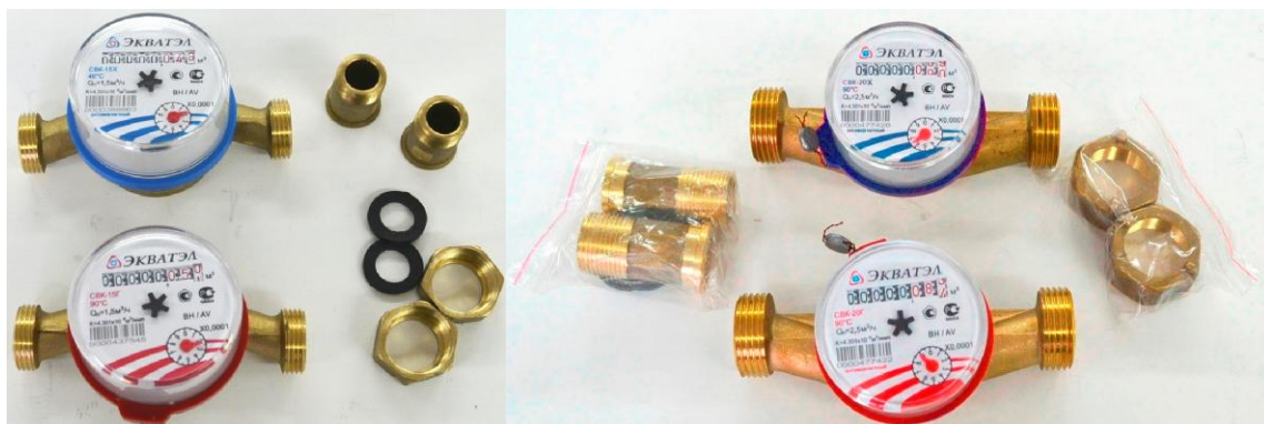
Рисунок 1 – Общий вид счетчиков воды крыльчатых СВК