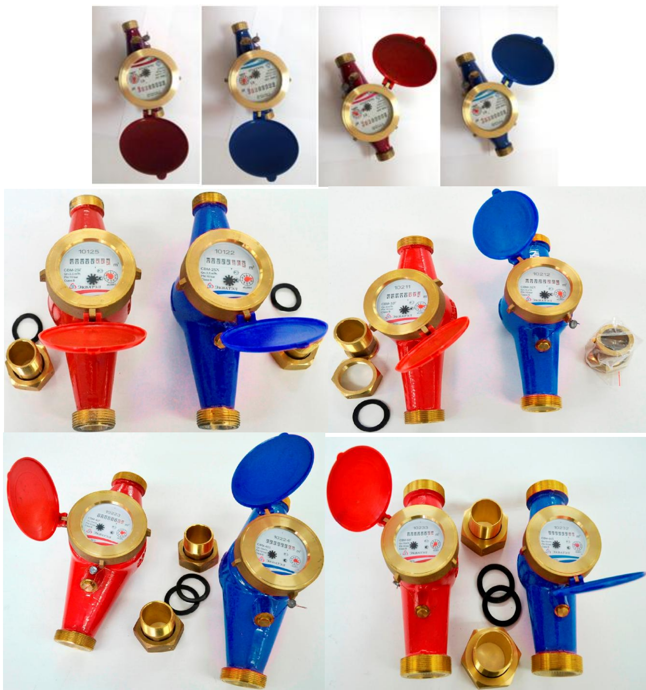
Рисунок 2 – Общий вид счетчиков воды крыльчатых СВМ