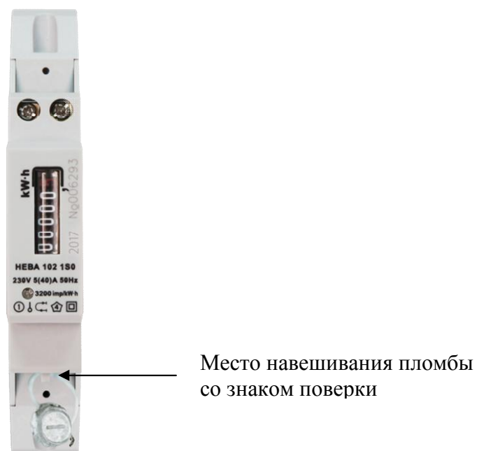
Рисунок 2 - Внешний вид модификации НЕВА 102 с местом опломбирования и местом нанесения знака поверки