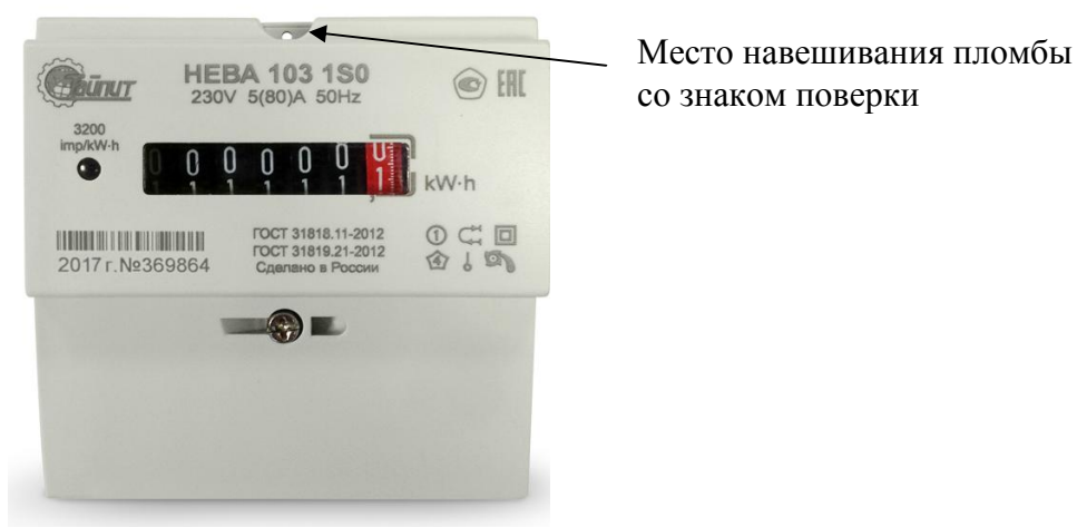
Рисунок 3 - Внешний вид модификации НЕВА 103 с местом опломбирования и местом нанесения знака поверки