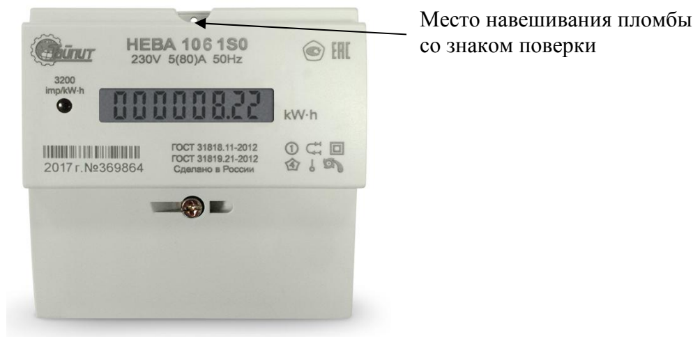
Рисунок 7 - Внешний вид модификации НЕВА 106 с местом опломбирования и местом нанесения знака поверки