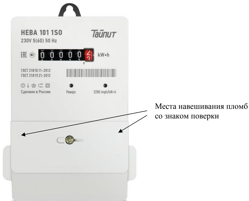
Рисунок 1 - Внешний вид модификации НЕВА 101 с местом опломбирования и местом нанесения знака поверки