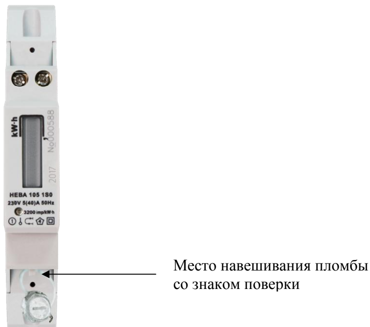
Рисунок 6 - Внешний вид модификации HEBA 105 с местом опломбирования и местом нанесения знака поверки