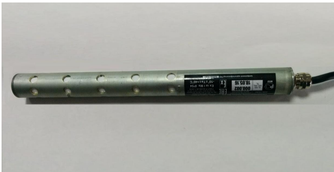
Рисунок 2 – Внешний вид блока датчиков GaSos.M2-EU