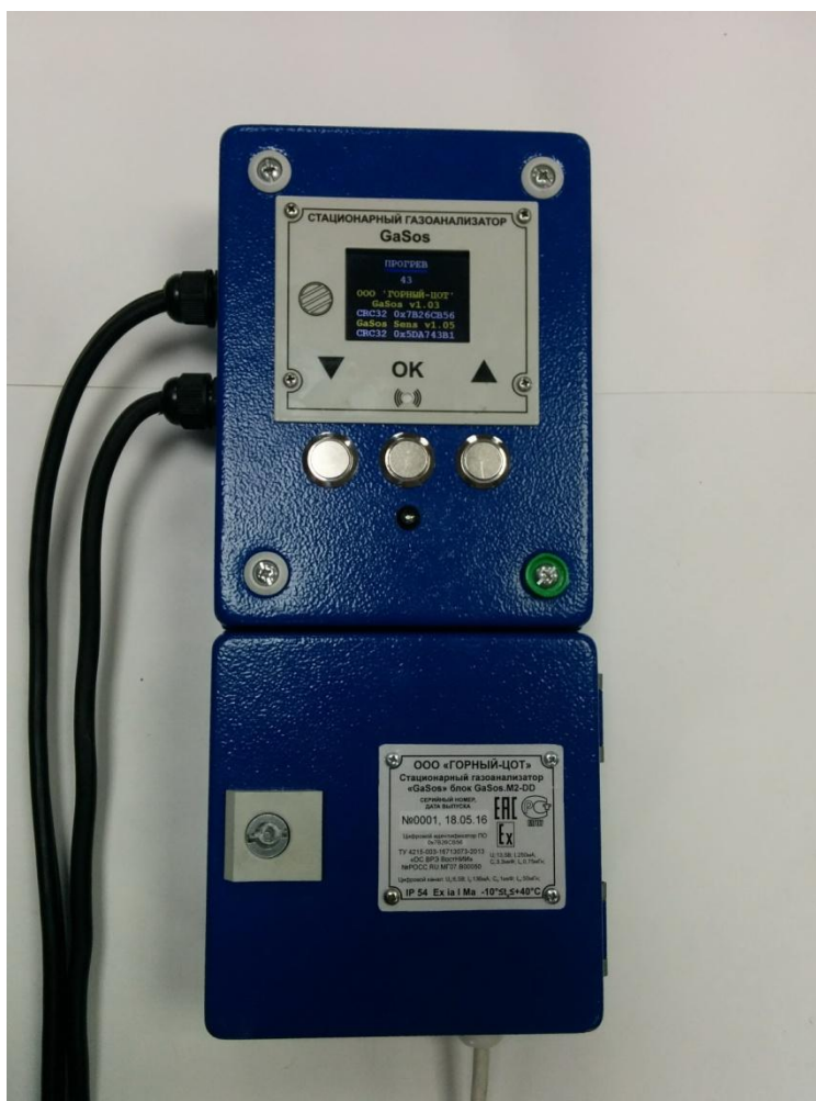
Рисунок 1 – Внешний вид блока измерения и индикации GaSos.M2-DD

Крышка корпуса блока измерения и индикации GaSos.M2-DD крепится винтами, один из которых пломбируется. Схема пломбирования корпуса блока измерения и индикации GaSos.M2-DD приведена на рисунке 3.