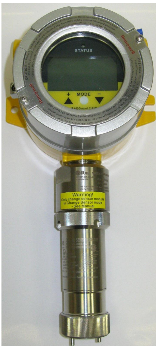
Рисунок 1 – Общий вид газоанализаторов

Общий вид газоанализаторов представлен на рисунке 1, схема пломбирования корпуса от несанкционированного доступа представлена на рисунке 2.