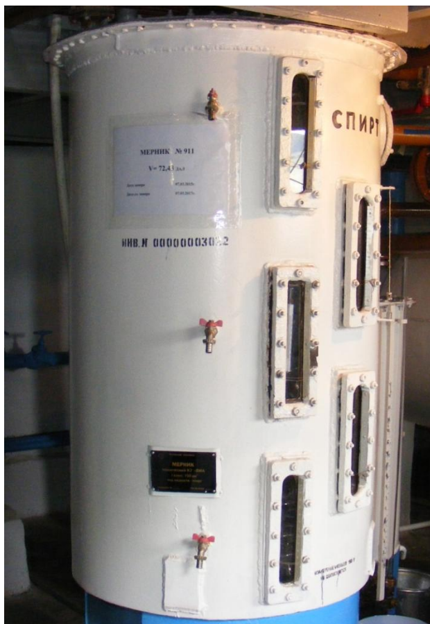
Рисунок 1 - Общий вид мерников металлических технических К7-ВМА

Общий вид мерников металлических технических К7-ВМА, схема пломбировки от несанкционированного доступа, обозначение места нанесения знака поверки представлены на рисунках 1 и 2.