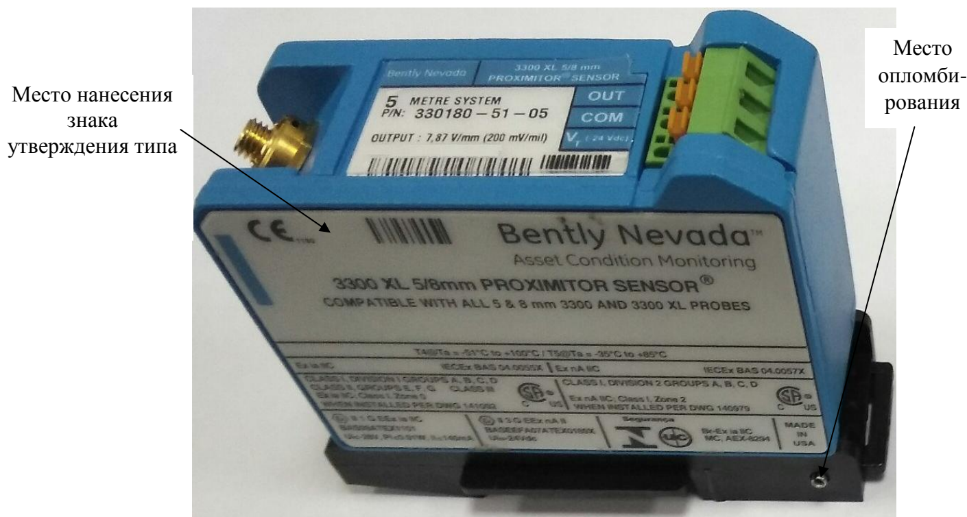
Рисунок 2 - Общий вид вторичного преобразователя модификации BN-330180-51-05