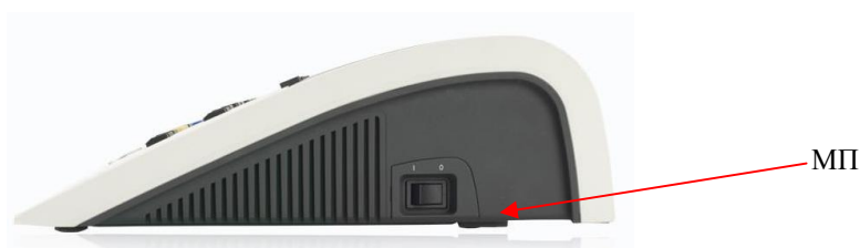
Рисунок 1 - Общий вид аудиометра