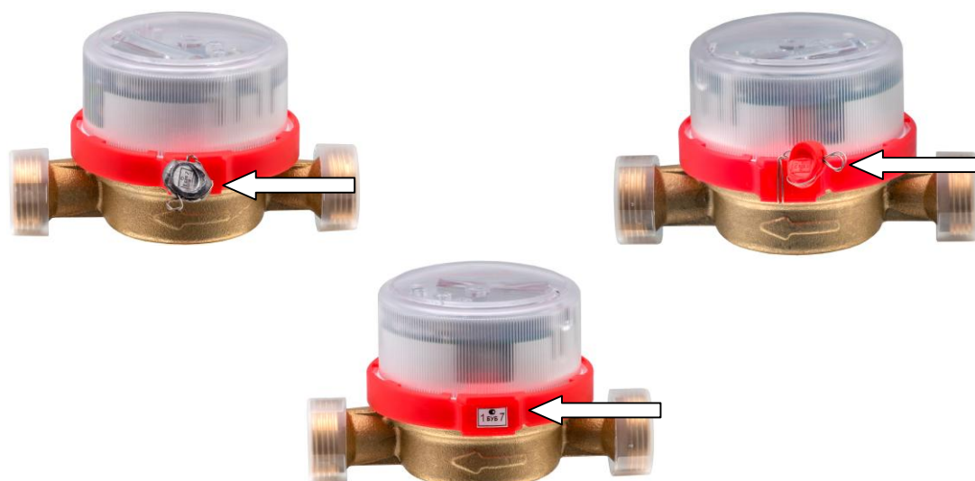
Рисунок 3 - Схема пломбировки от несанкционированного доступа, обозначение места нанесения знака поверки счетчиков воды крыльчатых электронных СХВЭ, СГВЭ

Пломбировка счетчиков воды крыльчатых электронных СХВЭ, СГВЭ осуществляется нанесением знака поверки оттиском клейма на самоклеющуюся наклейку, прикрепляемую на пластиковый хомут, который соединяет корпус и электронный блок, или давлением на свинцовую (пластмассовую) пломбу, навешиваемую на внешнюю боковую сторону счетчика с применением проволоки, пропущенную сквозь отверстия в пластиковом хомуте. Место пломбировки счетчиков воды крыльчатых электронных СХВЭ, СГВЭ представлено на рисунке 3.