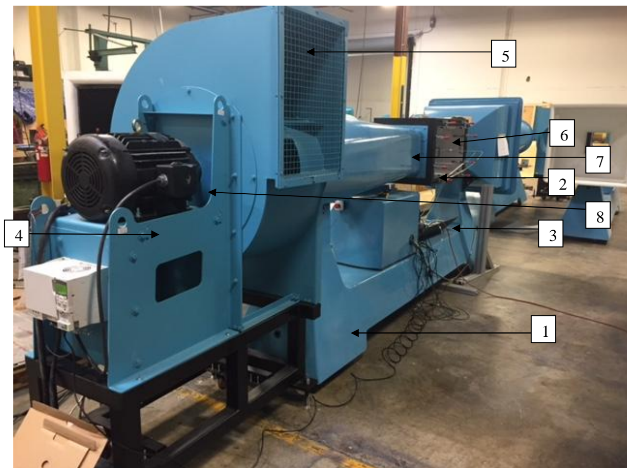
Рисунок 1 - Общий вид стационарных поверочных наборов для средств измерений параметров воздушного потока СПН-4

1 - основание, 2 - система крепления образцов, 3 - ПК, 4 - основание электромотора, 5 - воздухозаборник, 6 - рабочая камера, 7 - диффузор, 8 - электродвигатель с вентилятором