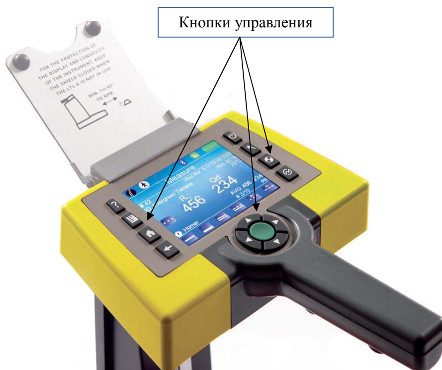
Рисунок 6 - Панель управления ретрорефлектометров LTL-XL