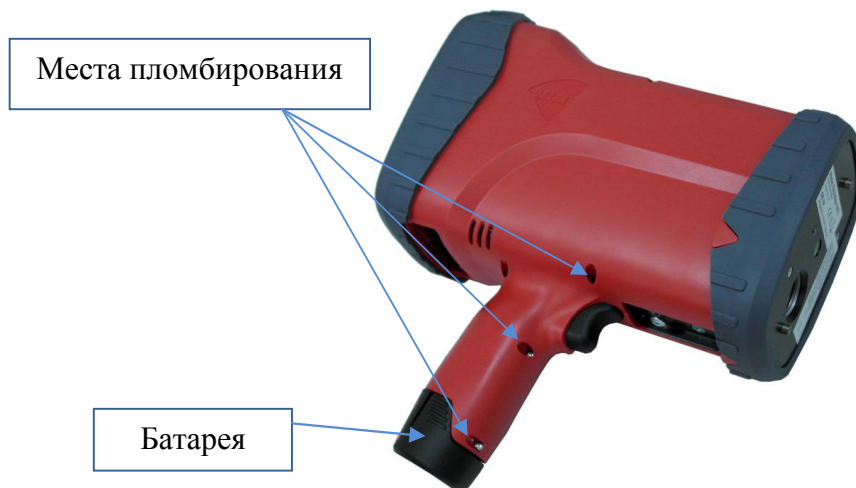
Рисунок 5 - Схема пломбировки от несанкционированного доступа ретрорефлектометров RetroSign GRX