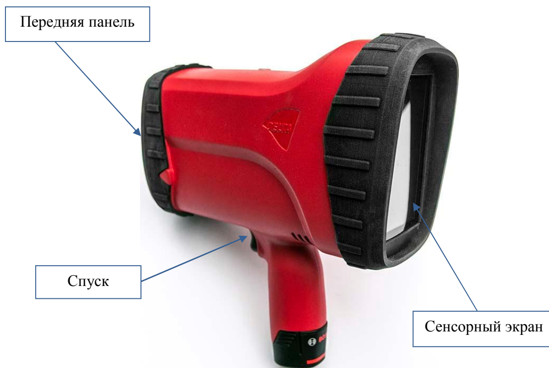
Рисунок 1 - Общий вид ретрорефлектометров RetroSign GRX