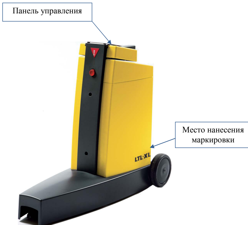
Рисунок 2 - Общий вид ретрорефлектометров LTL-XL