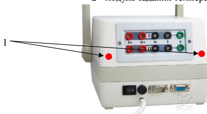
Рисунок 2 - Схема пломбирования наборов стационарных поверочных для средств измерений температуры СПН-2 1 - пломбы на корпусе преобразователя сигналов ТС и ТП прецизионного Теркон.