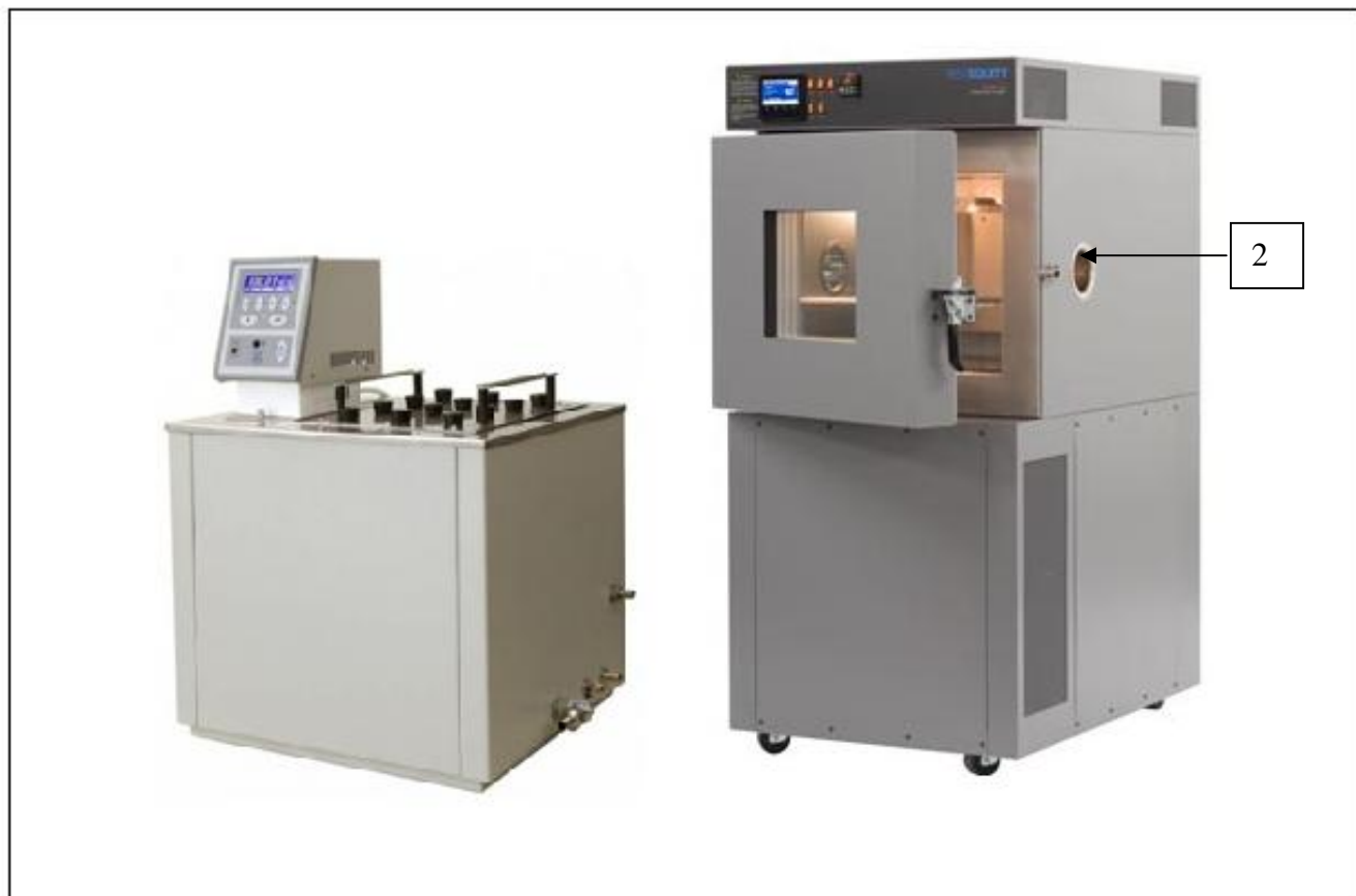
Рисунок 1 - Общий вид наборов стационарных поверочных для средств измерений температуры СПН-2 1 - модуль измерительный, 2 - модуль задания температуры.